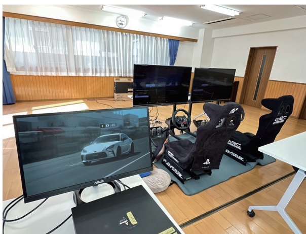
機材も少しずつ傷んできておりますが、修理を出来る部分は自分たちで修理をし、無駄な費用がかからないように工夫しています。それでも、壊れてしまう機材がありますので、都度補修したり、新規購入したりします。そのためにも、皆様からのご支援・ご寄付は活動継続に必要です。

児童養護施設は、地域社会とどう関わることが今後の大きな課題です。施設の外の人々と交流する機会が増えれば、子どもたちは社会に出る準備がしやすくなります。たとえば、地域の企業が職場体験の場を提供する、地域の大人たちがボランティア