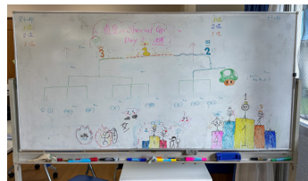
真夏のグランツールスモ大会の様子。二日間かけて予選・決勝と楽しみました。トーナメント表は、みんながイラストを描き込んでくれました。※画像内の名前は消えています

こそが大切な学びだと思えます。人生には負けることがつきものです。大事なのは、負けたあとにどう立ち直り、次にどう挑むか。遊びの中でその一端を体験できることは、子どもたちにとって大きな財産になると信じています。