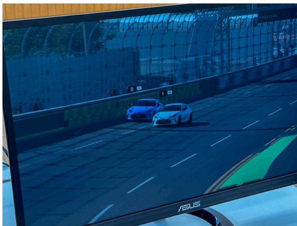
わずかな差を競い合う、手に汗握る接戦。子どもたちの真剣な表情が会場を熱くしました。周りで見ているみんなも、一緒に応援をしていました。

そのために、活動を組織として育て、いずれば子どもたち自身が大人になってこの活動を引き継ぐ未来を夢見ています。